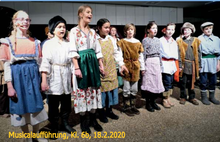
Musicalaufführung, Kl. 6b, 18.2.2020

Die ganzheitliche Entwicklung unserer Schülerinnen und Schüler wird im Unterricht gefördert und durch zusätzliche Angebote gestärkt: