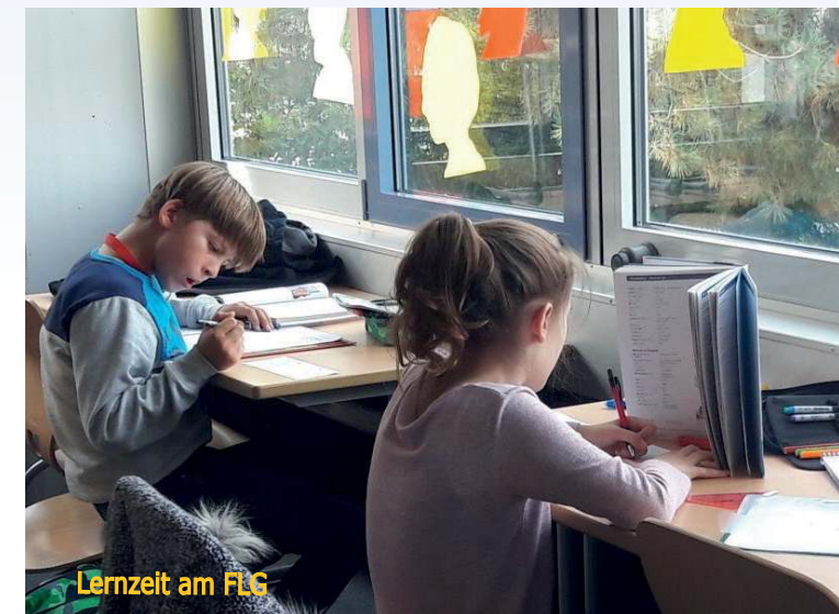
Lernzeit am FLG